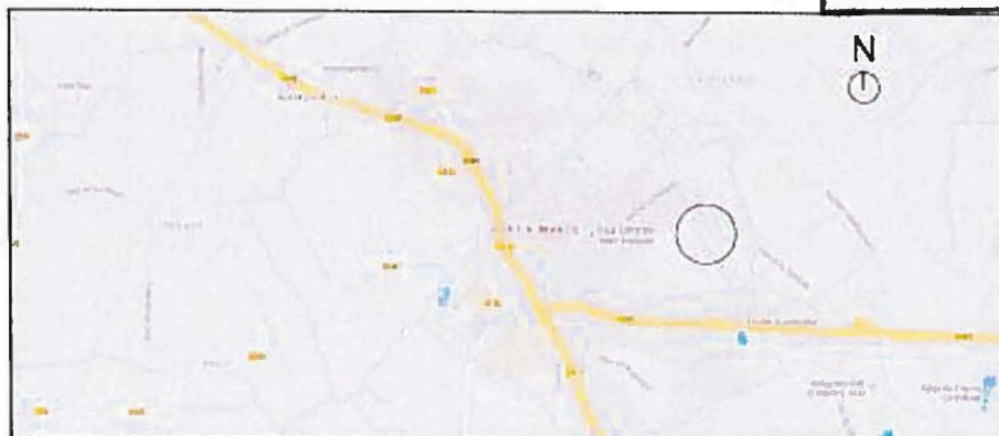
PC1 Plan de situation